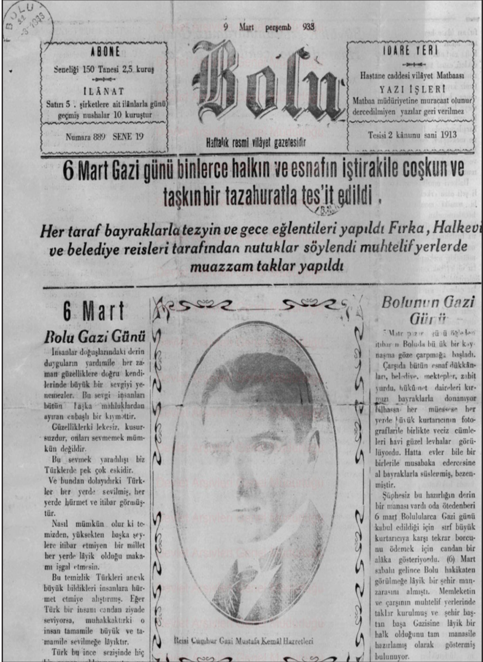
Ek1. "6 Mart Gazi Günü", Bolu, S.889, 9 Mart 1933.