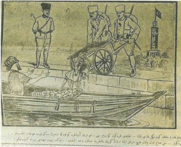
Karikatür 22. 13 Eylül 1922 Tarihli Karagöz

Bursa’nın kurtuluş hazırlıkları sırasında, kaplıcalarda bütün ağırlarından kurtulan Hacivat Karagöz’e teşekkür ederken, Karagöz’ün verdiği cevap şöyledir: “ Bana değil, orduya, millete, paşaya dua et Hacivat, bak şu saatte Efsunlar denize sürülürken biz ılık ılık banyolarda ense yapıyoruz! ” 30 . İzmir’in düşman işgalinden kurtuluşunun ardından çıkan Karagöz ’de, İzmir Saat Kulesi’nin önünde Mustafa Kemal Paşa ile Karagöz arasında şu konuşma geçiyordu: