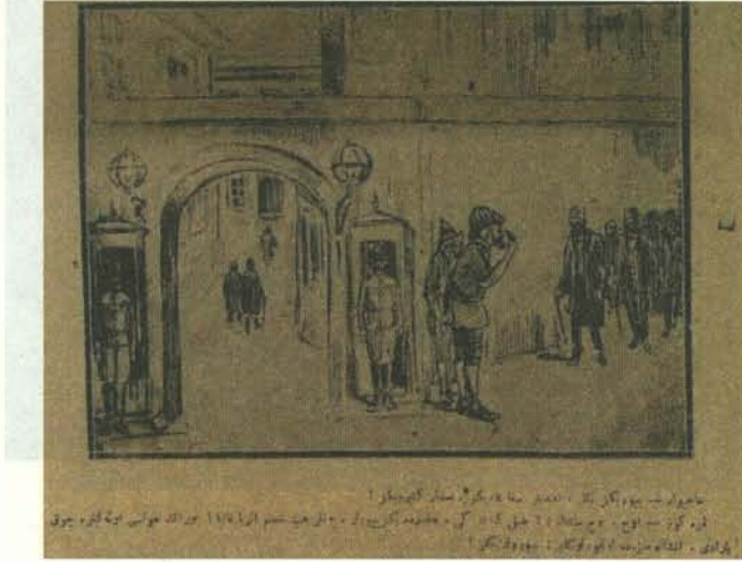
Karikatür 10. 14 Ocak 1920 tarihli Karagöz.

açılması kararını almış ve ülke genelinde seçimlere gidilmişti. Ülke genelinde gerçekleşen seçimde, mebuslukların çoğunu Anadolu ve Rumeli Müdafaa-ı Hukuk Cemiyeti adayları kazanmıştı. Meclis'in açılışını, seçimler sonrası oluşan yeni yapısını ve geleceğini Karagöz 'ün sütunlarına şöyle yansımıştı: