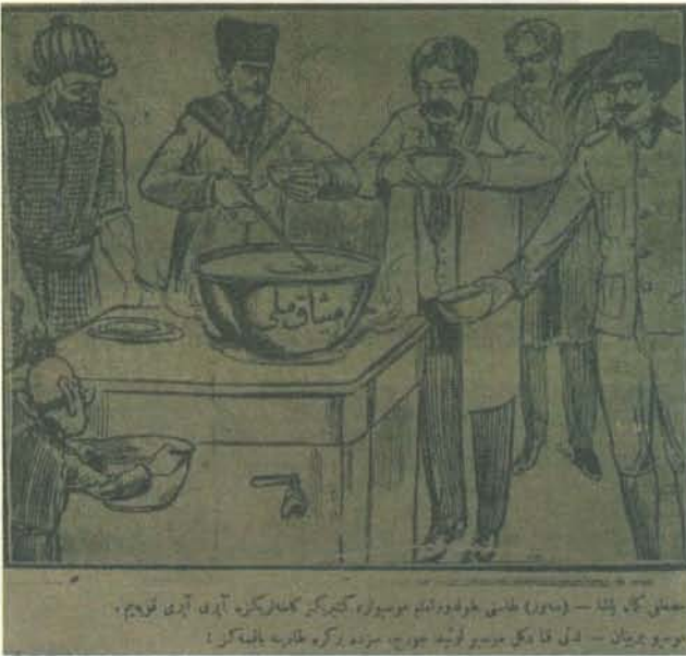
Karikatür 20. 19 Kasım 1921 Tarihli Karagöz

Müttefikler, savaşın Türkler lehine gidişine aldırmadan, Sevr taslağı üzerinde yeni bir çözüm arayışına girişmesi karşısında; barış konusunda artık inisiyatifin Ankara'ya ve Mustafa Kemal Paşa'ya geçtiğine değinen Karagöz , Mustafa Kemal Paşa'yı, bir ocağın üstünde üzerinde "Misak-ı Milli" yazan bir kazan çorbanın başında resmediyordu. Kazanın çevresinde, ellerinde kâselerle gelmiş bulunan müttefik temsilcileri ve Yunan Kralına servis yapan Mustafa Kemal Paşa şu ifadelerde bulunuyordu: