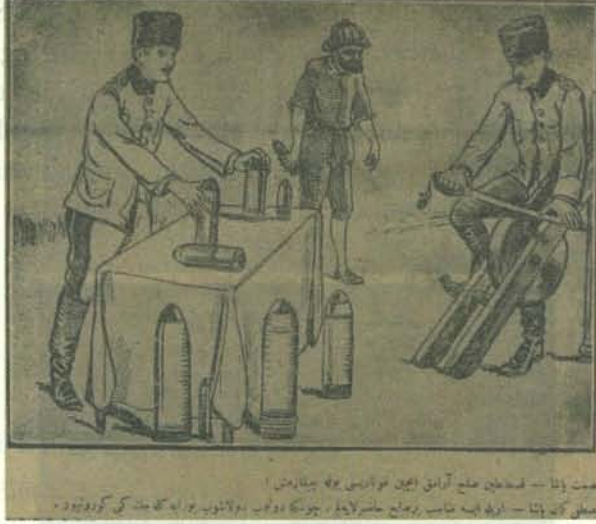
Karikatür 19. 26 Ekim 1921 Tarihli Karagöz

rış konusundaki inisiyatifin Ankara'ya geçtiğini, Karagöz sütunlarına yansıtıran, ilginç temalar işlemiştir. Bunlardan biri, üzerinde ve etrafında top mermileri bulunan bir masanın arkasında İsmet Paşa ve karşısında kılıcını bileyen Mustafa Kemal Paşa resmedilirken, ikili arasında geçen konuşma aynen şöyleydi: