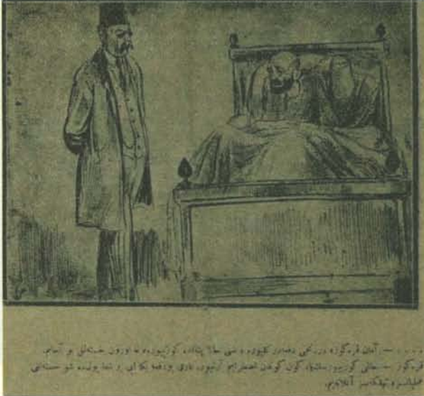
Karikatür 11. 7 Nisan 1920 tarihli Karagöz

rilmiş; kimi milletvekilleri ise 19 Mart tarihinde Mustafa Kemal Paşa tarafından Ankara'da açılacağı duyurulan Meclis'e katılmak üzere Anadolu'ya hareket etmişti. Damat Ferid Paşa, padişah tarafından tekrar hükümeti kurmakla görevlendirilmişti. Dördüncü defa hükümet kuran Damat Ferid, Kurtuluş savaşı aleyhinde bulunduğu faaliyetleriyle, Anadolu'nun sert tepkisini üzerinde toplamıştı. Göreve geldikten sonra, geçmiş dönemdeki siyasetine devam edecekti. İstanbul'un en hareketli günlerinde, çekinmeden Damat Ferid'in hükümete gelişini sütunlarına taşıyan Karagöz , üstü kapalı olarak hükümete yönelik eleştirilerini ve ülkenin mevcut halini şöyle dile getirmişti: