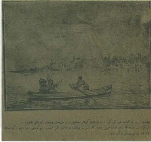
Karikatür 12. 1 Mayıs 1920 tarihli Karagöz

Ulusal Kurtuluş Savaşı'nın örgütlenme süreci tamamlanırken, tam bağımsızlık hedefini başarıya ulaştırmak adına, silahlı savaş süreci başlayacaktı. Bu süreç içinde, iç isyanlar, düzenli ordunun kuruluşu sırasında yaşanan sıkıntılar, maddi yoksunluklar çözümlenmesi beklenen en önemli sorunlar olarak TBMM'nin önünde yer alıyordu. Anadolu'da yaşanan gelişmeler İstanbul'da milli mücadeleyi destekleyen gruplar tarafından merakla takip edilirken; Anadolu'dan gelen haberler kimi zaman karamsarlık kimi zamanda umut yaratıyordu. Diğer yandan İstanbul, işgal sonrası artan müttefik baskısıyla yaşanır bir şehir olmaktan çıkmıştı. İstanbul'un zaman içinde yaşadığı duygu geçişleri Karagöz 'ün sütunlarına yansırken, beklentileri şöyle ortaya koymuştu: