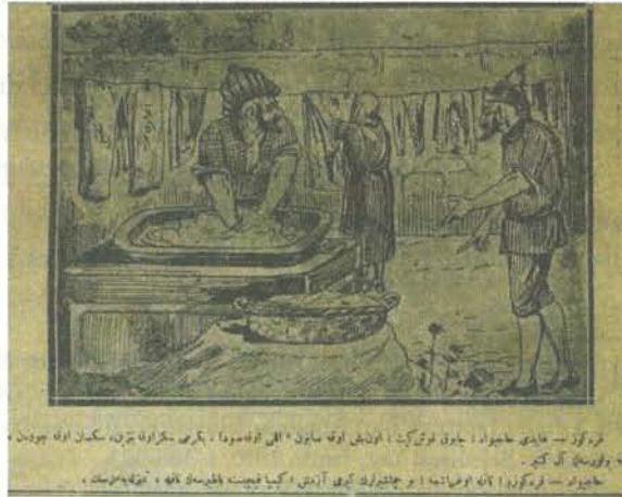
Karikatür 2. 29 Mart 1919 tarihli Karagöz.

İttihatçılığa yöneltilen suçlamaları sütunlarına taşıyan bir diğer mizah dergisi Karagöz , ittihatçı düşmanlığını resmederek, okuyucuya bir kaç cümle içinde şöyle yansıtmıştı: