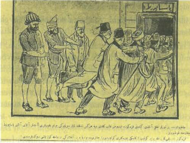
Karikatür 23. 27 Eylül 1922 Tarihli Karagöz

Hacivat: Bir türlü aklım almadı gitti Karagöz, ordumuz galip geldi diye herkes şenlik yapar sevinirken bunlar bavulları almışlar alay alay pasaport çıkarmaya koşuyorlar.