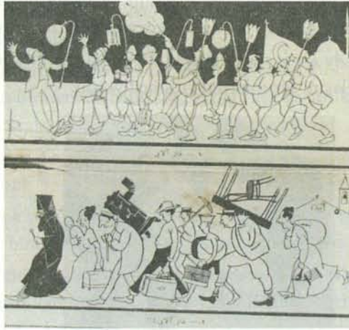
Karikatür 25. 9 Kasım 1922 Tarihli Ay Dede

11 Ekim tarihinde imzalanan Mudanya Ateşkes Antlaşması, 15 Ekim'de yürürlüğe girmişti. Anlaşmanın yürürlüğe girmesinin ardından on beş gün içinde Yunan kuvvetleri Doğu Trakya'yı boşaltacak ve 1 Kasım itibariyle 8 bin kişilik Türk Kuvveti Rumeli yakasına geçecekti. Bu Ankara adına büyük bir başarı iken, Kurtuluş Savaşı'nın silahlı evresi sona ermişti. İstanbul heyecanlı günler yaşarken, Karagöz Mustafa Kemal Paşa'nın Türk bayrağı ile bir sandalın üstünde Rumeli'ye geçişini resmederek şu ifadelerde bulunuyordu: " Tarih tekerrür eder derler. Türkler Avrupa'ya beş yüz sene evvelde böyle geçtilerdi! " 32 . Ay Dede , İstanbul sokaklarında "Kalpak"ın itibarına vurgu yaparken 33 ; Türklerin İstanbul'a geçişine farklı bir boyuttan yaklaşarak, İstanbul'da kalan Rumların aciz durumunu sütunlarına yansıtıyordu. İstanbul'daki Türklerin sevincini "Fener Alayı" şeklinde resmederken; başlarında Fener Rum Patriğinin bulunduğu İstanbullu Hıristiyanların, eşyalarını sırtlayarak gidişini de "Fener Alayı" şeklinde veriyordu 34 .