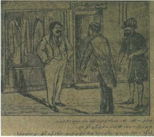
Karikatür 18. 22 Ekim 1921 Tarihli Karagöz

Sakarya Savaşı sonrası müttefikler nezdinde Türkleri barışa ve sükûnete razı etme çabaları Karagöz 'ün sütunlarına yansımıştı. Yunanistan'ın Sakarya Savaşı sonrası saldırı yeteneğini kaybetmesi, müttefiklerin, bilhassa İngiltere'nin Sevri Antlaşmasına Türklere kabul ettirme umudunu tamamen yok etmişti. Müttefikler ve Yunanistan adına umulan, mevcut toprakların elde nasıl tutulacağı ve Türklerin olası saldırısının nasıl engelleneceği sorunuordu. Mevcut durumu sütunlarında Karagöz şöyle resmediyordu: