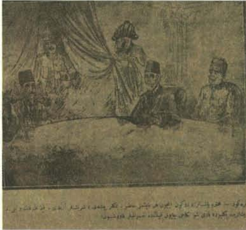
Karikatür 15. 27 Ekim 1920 tarihli Karagöz

likte İstanbul basını üzerinde kendini belli eder olmuştur. İncelediğimiz dönem içinde Karagöz 'ün sütunlarında ilk kez Mustafa Kemal Paşa'yı 27 Ekim 1920 tarihinde görüyoruz. Bu durum, İstanbul basınının, Anadolu hareketinden aldığı güçle, Türklerin haklı davasını net bir şekilde ortaya koymaya başladığını göstermesi açısından dikkat çekicidir. Mustafa Kemal Paşa'nın yer aldığı çizimde (bkz: Karikatür 15), hükümeti kuran Tefvik Paşa'nın da bulunduğu bir masanın arkasında yer alan perdeyi Karagöz aralıyor ve perdenin ardından Mustafa Kemal Paşa, damat adayı nitelenmesi ile yer alıyordu. Bu tarihten sonra sık sık Mustafa Kemal'i sütunlarına taşıyan Karagöz , yeri geldiğinden milli mücadeleyi örgütleyen olarak gördüğü Mustafa Kemal Paşa'dan "Aşçıbaşı" 10 ; taktik ve ustalığını ön plana çıkan bir "bیلardo ustası" 11 ; tüm Anadolu'yu ayırık otlardan temizleyen "Paşa" 12 ; rakibini kavrayarak yere sermekte olan bir "Güreşçi" 13 ; Yunan Kralı'nın dişlerini söken bir "Doktor" 14 olarak niteleyecekti.