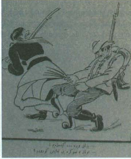
Karikatür 21. 30 Mart 1922 Tarihli Ay Dede

Kaçmaya çalışan Yunan askerini elbisesinden tutan bir Türk askeri resmedilirken;