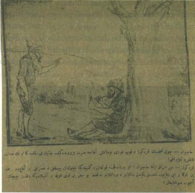
Karikatür 13. 31 Temmuz 1920 tarihli Karagöz.

Karamsarlığın kendisini en yoğun hissettirdiği günlerde, Milli Mücadeleye olan inancını kaybetmeyen Karagöz , bu inancının temelini Türk toplumunun büyüklüğüne ve hayatta kalma umudunun azaldığı şartlarda ortaya çıkan hayatta kalma özelliğine bağlıyordu. Bu inancını çizgilerine yansıtan dergi, bir sayısında bu inancını şöyle tasvir ediyordu: