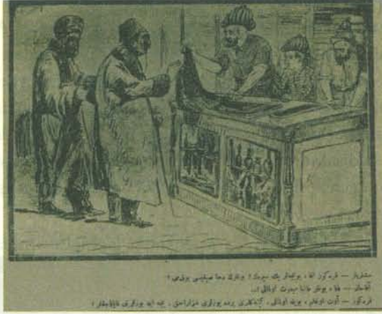
Karikatür 4. 1 Ocak 1919 Tarihli Karagöz.

Meclis'in kapatılması gibi olumsuzlukları çizgilere döken dergi, bu olumsuzlukların baş sorumlusu olarak gördüğü Padişah VI. Mehmet Vahdettin'i de sütunlarına taşıyordu. Padişahın uygulamalarına üstü kapalı eleştiriler getirilirken; rahatsızlık verici uygulamalar sonrası padişahın düştüğü durumu, bir sayısının ilk sayfasına taşıdığı karikatürle şöyle tasvir etmektedir: