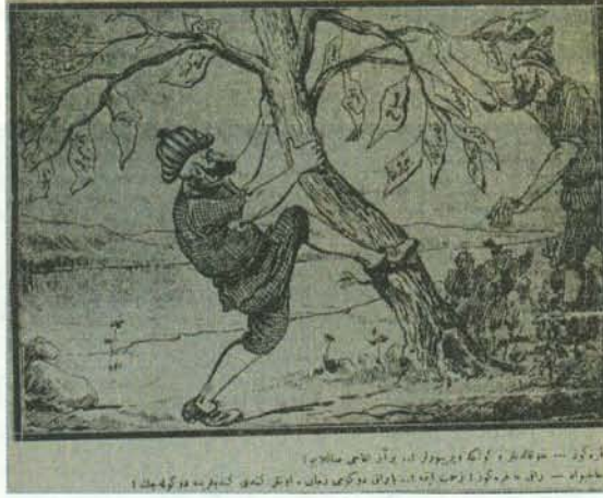
Karikatür 6. 30 Aralık 1918 Tarihli Karagöz

Karikatürde, Mütareke Dönemi İstanbul'unda yayın yapmakta olan, arasında Karagöz 'ünde bulunduğu gazete ve dergi isimlerinin yapraklarında yer aldığı bir ağaç tasvir edilirken