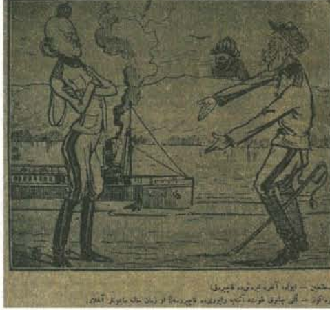
Karikatür 16. 22 Haziran 1921 Tarihli Karagöz

Konstantin: Eyvah! Ankara trenini de kaçırdık!