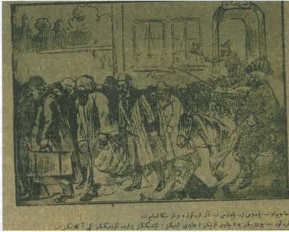
Karikatür 3. 28 Aralık 1918 Tarihli Karagöz.

Mütareke İstanbul'unda hâkim olan ittihatçı karşıtlığı, 21 Aralık tarihinde Mebuslar Meclisi'nin Padişah VI. Mehmet Vahdettin tarafından kapatılmasının en önemli gerekçesini oluşturmuştu. İttihatçı önderlerin ülkeyi terk etmesine ve yönetimden ayrılmasına karşın, meclis çoğunluğunun ittihatçılardan olduğu yolundaki algıların güçlü olması ve İngilizlerin meclisin faaliyetlerinden duyduğu rahatsızlık ve padişahın yeni süreçte rahat hareket etme istek ve arzusu meclisin kapatılmasının gerekçelerini oluşturmuştu 5 . Yaşanan bu gelişme Karagöz 'ün sütunlarında şöyle yer alıyordu: