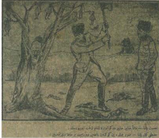
Karikatür 17. 24 Eylül 1921 Tarihli Karagöz

Karagöz: Elini çabuk tut, Atina'ya vapuru da kaçırırsan o zaman haline maymunlar ağlar.