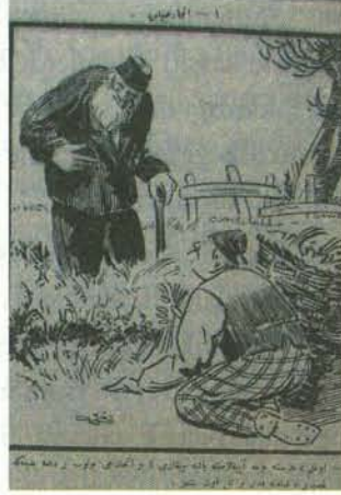
Karikatür 1. 23 Mart 1922 Tarihli Ay Dede

Bahçesini zararlı otlardan ayıklamaya çalışan çiftçiye yaşlı bir amcanın öğüdü