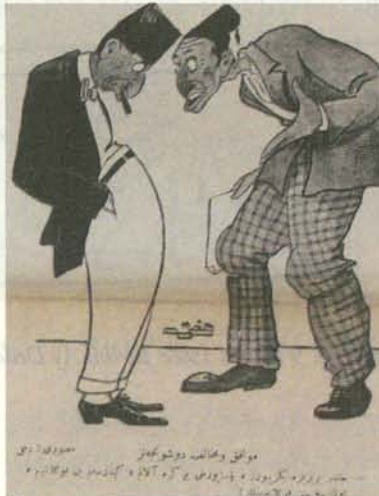
Karikatür 24. 21 Eylül 1922 Tarihli Ay Dede

Aynı günlerde Ay Dede sütunlarında da muhaliflerin konumu işleniyor ve pasaport çıkarma telaşını sütunlarında resmediyordu.