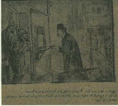
Karikatür 14. 23 Ekim 1920 tarihli Karagöz

İstanbul'un işgalinin ardından, tekrar göreve gelen Damat Ferid, Milli Mücadele aleyhindeki uygulamalarını artırarak devam ettirecekti. Başta Mustafa Kemal Paşa olmak üzere Milli Mücadele önderleri aleyhinde fetvalar çıkarılması ve idam kararı alınması, Ahmet Anzavur'u isyan çıkarmak suretiyle milli kuvvetleri dağıtmak göreviyle Anadolu'ya göndermek gibi uygulamalar bunlardan bazılarıydı. Fakat İstanbul Hükümetinin tüm olumsuz uygulamalarına karşın, Anadolu hareketi, TBMM'nin açılmasının ardından, ulusun tüm egemenlik erklerini kendi bünyesinde toplamıştı. İstanbul'un egemenlik alanı kısıtlanırken, artık İstanbul'un Anadolu ile bir uzlaşma haline gelmesi yolunda görüşler ortaya konulur olmaya başlamıştı. Bu durum karşısında Damat Ferid 17 Ekim 1920 tarihinde son kez hükümetten ayrılacak; ardından Tevfik Paşa hükümeti göreve gelecekti. Damat Ferid'in içine düştüğü aciz durum Karagöz tarafından şöyle tasvir edilmişti: