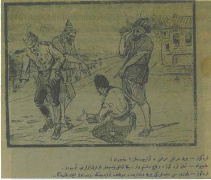
Karikatür 9. 23 Temmuz 1919 tarihli Karagöz.

Bir telaş içinde, askerlerle etrafı araştıran Hacivat'a