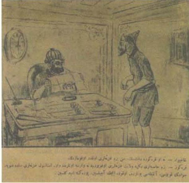
Karikatür 8. 4 Şubat 1920 Tarihli Karagöz

Karikatürde, oturduğu masa başında elinde İrade-i Milliye gazetesini okuyan Karagöz tasvir edilirken;