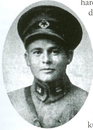
Mustafa Fehmi Kubilay

Cumhuriyet Tarihinin en önemli olaylarından biri de tarihe "Menemen Olayı" olarak geçen gerici ayaklanmadır. Olayın çeşitli nedenleri olmakla birlikte, en temel neden, dönemin ekonomik zorlukları altında bunalan yöre halkını, henüz ilke ve değerleriyle henüz yerleşmeye başlayan Cumhuriyet rejimine başkaldırmayı amaçlayan kışkırtmadır.